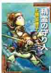
上「獣の奏者」上橋菜穂子／講談社 下「利益の守り人」上橋菜穂子／新潮社