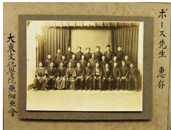
(記録：大東文化大学 中島 裕子)