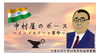
大東文化大学 中村屋のボース —インドカリーと革命—