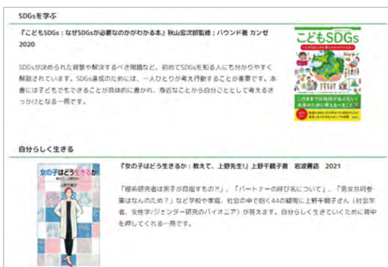
小学校高学年向け図書紹介