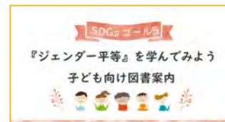
国立女性教育会館 SDGs ゴール5『ジェンダー平等』を学んでみよう 子ども向け図書案内