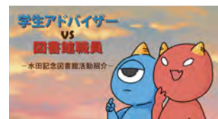
城西大学 学生アドバイザー vs 図書館職員 ~水田記念図書館活動紹介~