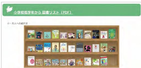
小学校低学年向け本棚

2015年に国連で採択されたSDGs（持続可能な開発目標）のゴール5は「ジェンダー平等を実現しよう」です。WEB展示にあたり、当館所蔵資料からジェンダー平等について学べる図書、絵本を小学校低学年向け、高学年向けに選びました。図書リストやブックログの本棚を作成し、「じぶんらしく生きる」、「道をきりひらいた女性たち」などテーマごとにピックアップして紹介しました。