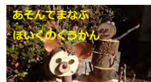
山村学園短期大学 あそんでまなぶ ほいくのくわかん